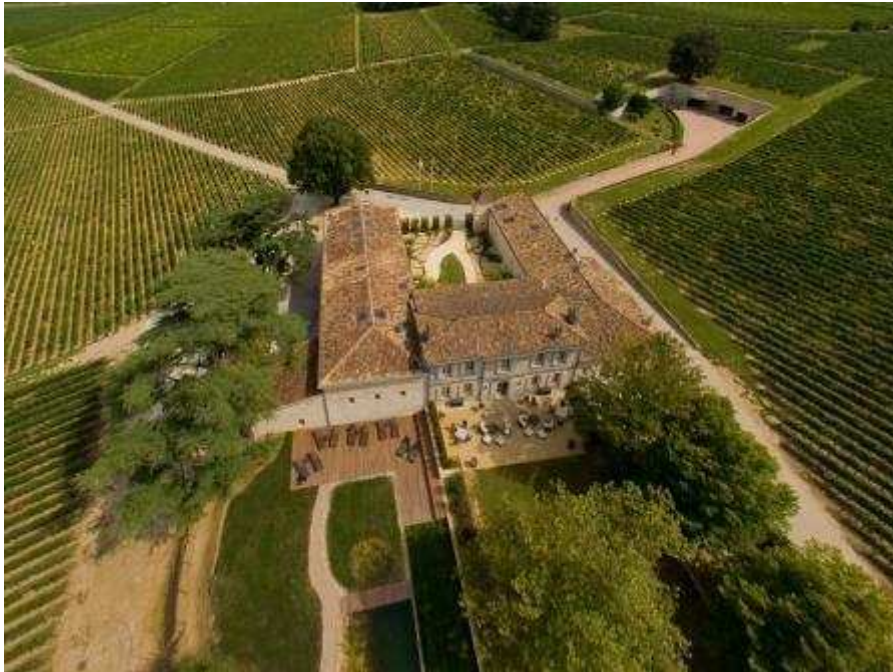
Château Franc Mayne en zijn hotel

Franc Mayne is bijzonder omdat het over een uniek ondergronds gangensysteem beschikt, met dezelfde uitstraling als het hele domein. Franc Mayne geniet ook van een goed terroir met een unieke bodem en een wijn met reeds een sterke reputatie.