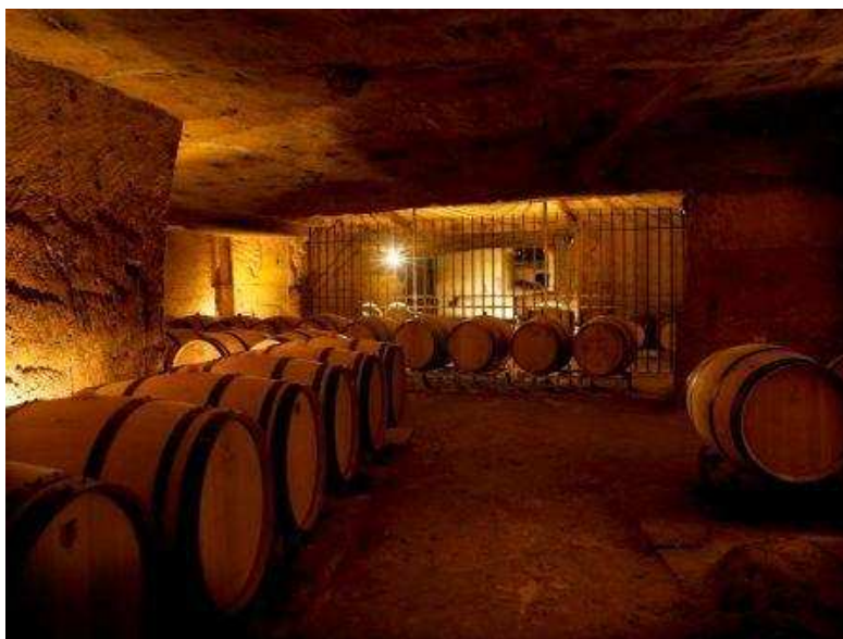
Kelders Château Franc Mayne

Oppervlakte: eerste getal is vermeld op technische fiche van Lussac, tussen ( ) is cijfer van G.H.