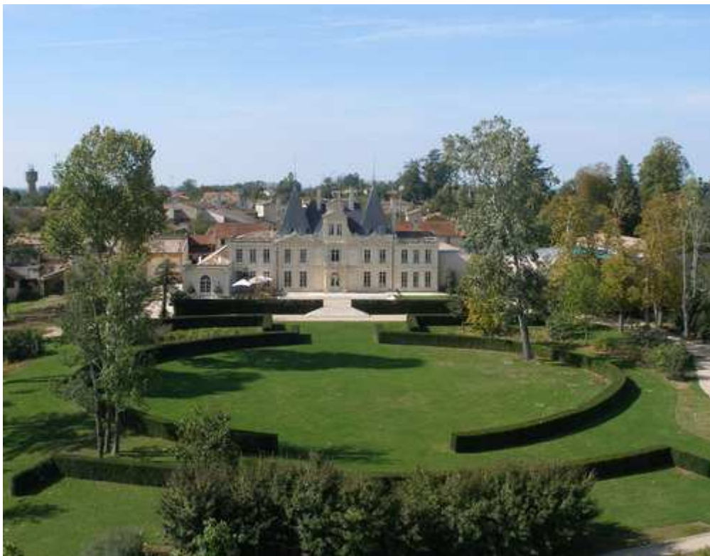
Château de Lussac

Het productieproces is geëvolueerd van 30 % eerste wijn en 70 % tweede wijn in 2000 naar 70 % eerste wijn en 30 % tweede wijn nu. Hun wijngaard is voor \frac{3}{4} beplant met Merlot en voor \frac{1}{4} met Cabernet Franc.