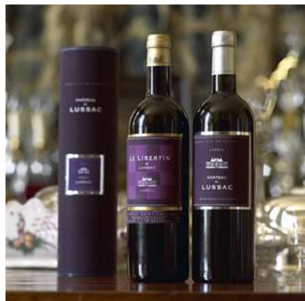
Wijnen Château de Lussac